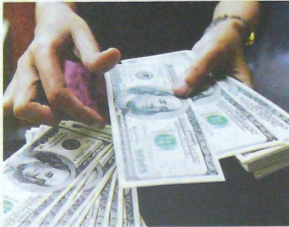
A JUNIO de 2019, el saldo de la deuda externa de Colombia alcanzó US$134.972 millones (41,6% del PIB)/ENS

El aumento del saldo fue explicado por el mayor endeudamiento de largo plazo, US$405 millones (0,6%), parcialmente compensado por la reducción del saldo de corto plazo, US$193 millones (25,2%).