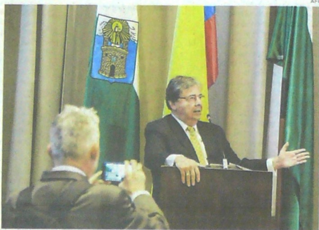
Carlos Holmes Trujillo, canciller de Colombia.

El canciller, desde su cuenta de Twitter, también se refirió a los abusos de Caracas contra la oposición y a la necesidad de elevar las denuncias del caso contra el gobierno chavista.