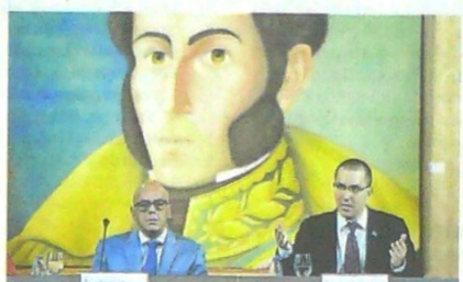
Jorge Rodríguez, ministro de comunicaciones, y Jorge Arreaza, canciller.

"Que ahora no salgan con bravuconadas de hablar de misiles en la zona de frontera; más bien, en vez de