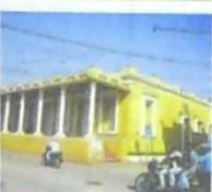
Fachada de la Alcaldía de Lórica, Córdoba.