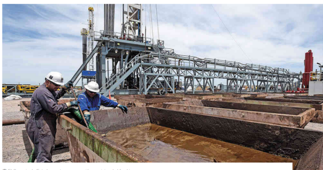
El Consejo de Estado mantuvo suspensión provisional al fracking

Mientras Ecopetrol anunció esta mañana que comenzó a operar el primer pozo con fracking en EEUU, en Colombia, el Consejo de Estado decidió mantener, esta tarde, las medidas cautelares que suspenden el uso de esta técnica en el país.