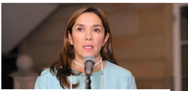
Sin fracking: ¿dólar a $5.000?

La ministra de Minas, María Fernanda Suárez, aseguró que sin fracking, el país estaría condenado a una devaluación que llevaría el dólar hasta los $5.000. ¿Es cierta esta alarma?