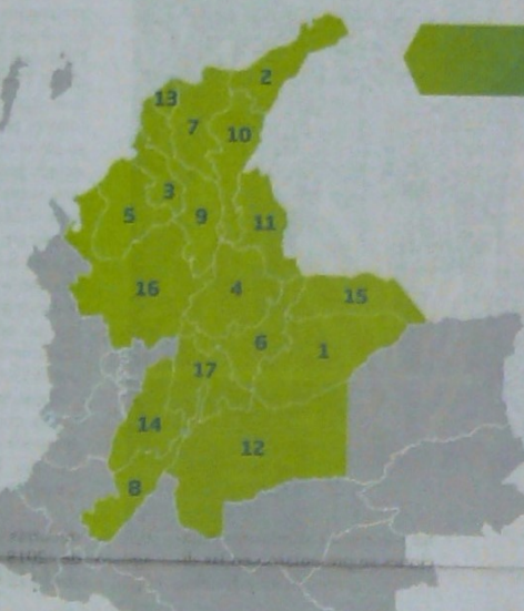
RESERVAS PROBADAS DE GAS NATURAL 2018 Gpc