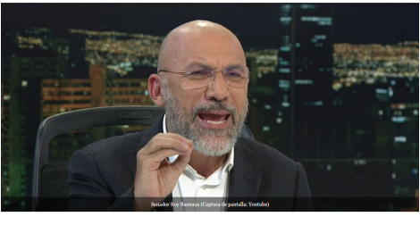
Senador Roy Barreras