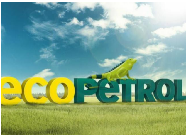
BLU Radio. Ecopetrol / Foto: Ecopetrol

La empresa intenta controlar el derrame de crudo en el río Tibú.