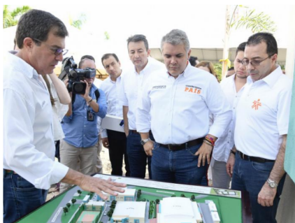
El presidente Duque visitó este sábado Montería.

POR: PORTAFOLIO - SEPTIEMBRE 07 DE 2019 - 05:42 P.M.