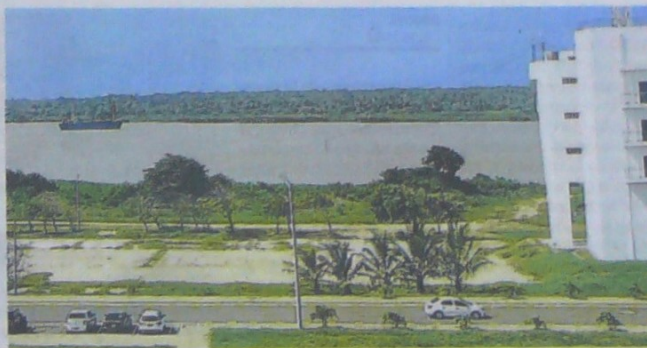
Río Magdalena a su paso frente a Barranquilla. // EL UNIVERSAL

El Universal conoció que en los últimos días tres embarcaciones que se dirigían a Barranquilla con cargamentos de maíz y que requerían un calado mayor a 8,1 metros debieron llegar a un terminal de la bahía de Cartagena para dejar parte de la carga.