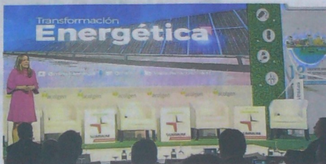
María Fernanda Suárez, ministra de Minas y Energía en el encuentro de Acolgen, en Bogotá. La ministra le apuesta la transformación energética, confiabilidad, eficiencia y sostenibilidad.

Aunque hace un año la capacidad instalada de energías renovables no convencionales en el país era menor de 60 megas, a la fecha ya es de 180 megas, y con las subastas de cargo por con-