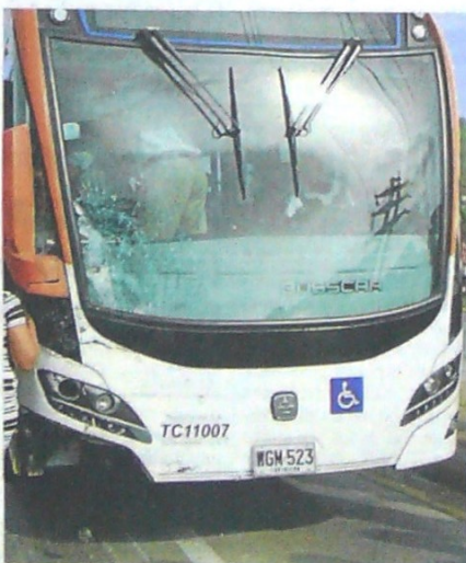
Un informe del Sector Gas Natural explica que por lo menos siete ciudades del país entraron en la dinámica del gas natural con sus sistemas de transporte masivo; Cartagena es una de ellas.

El Informe del Sector Gas Natural 2019 confirma que Colombia en 2018 contaba con 7.460 kilómetros de redes de