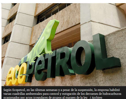
Según Ecopetrol, en las últimas semanas y a pesar de la suspensión, la empresa habilitó varias cuadrillas ambientales para control y mitigación de los derrames de hidrocarburos ocasionados por actos irregulares de grupos al margen de la ley.

Las operaciones se habían detenido como consecuencia de las condiciones de orden público que se presentaron, a raíz de operativos contra el contrabando de gasolina en la zona.