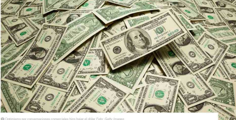
Optimismo por conversaciones comerciales hizo bajar el dólar

El anuncio de que China y Estados Unidos reanudarán conversaciones a principios de octubre generó optimismo en los mercados globales. La tasa de cambio bajó 0,52% y terminó la jornada en $3.380. El Grupo Bancolombia espera que continúe la senda bajista y se cotice entre $3.300 y $3.400 durante la próxima semana.