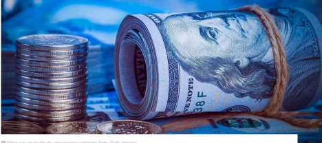
Dólar cae en medio de una semana optimista

Algunos anuncios económicos a nivel mundial permitieron darle descanso a la importante fortaleza que viene presentando el dólar frente a las diferentes monedas. ¿Por qué bajo el dólar esta semana?