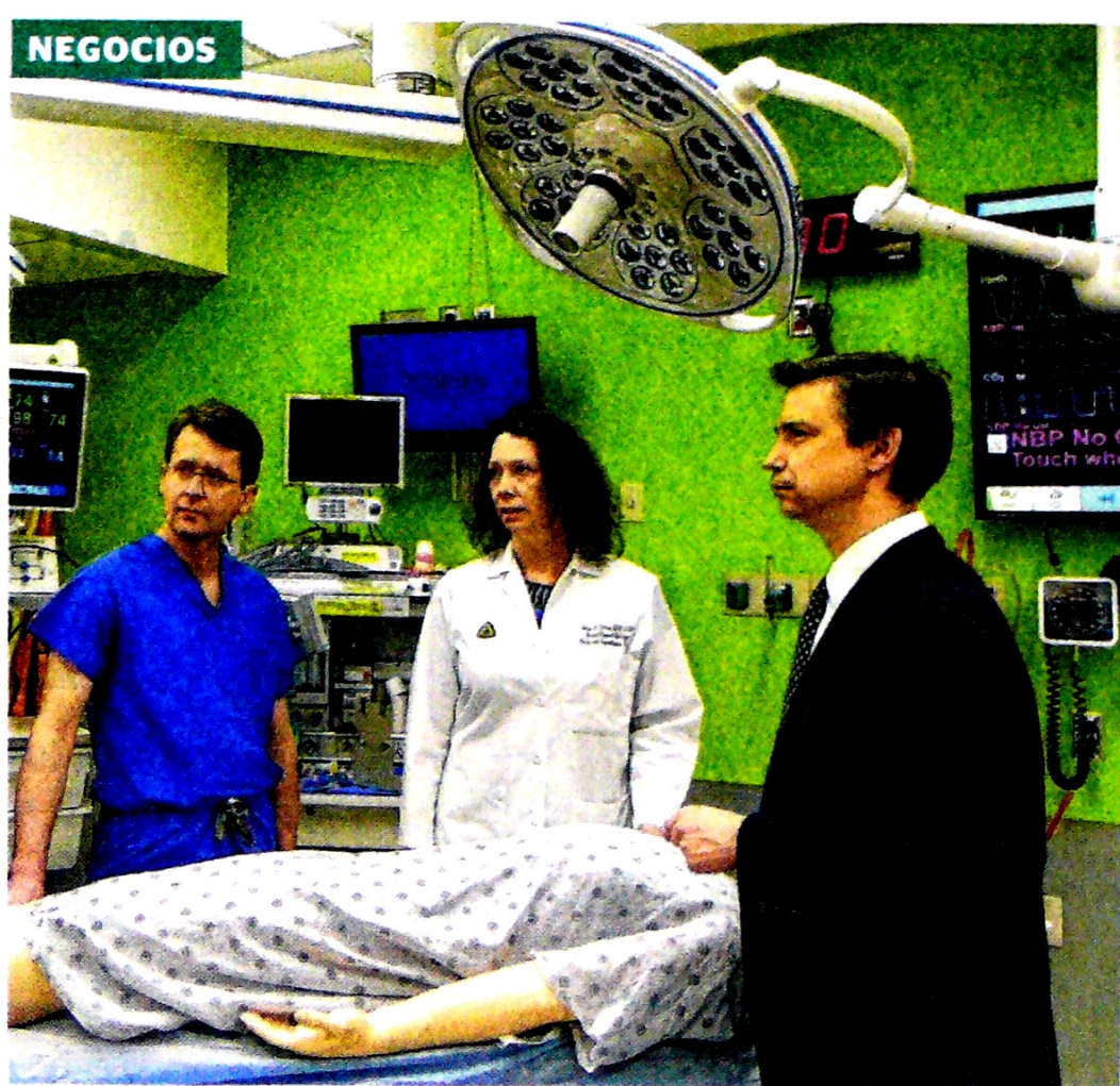
Los pacientes dicen que en Colombia los atienden rápido y a bajo costo.

Los gastos en alojamiento y servicios públicos, las comidas por fuera del hogar y las mayores tarifas en el transporte jalonaron el Índice de Precios al Consumidor del mes pasado, según el Dane. Pág. 9