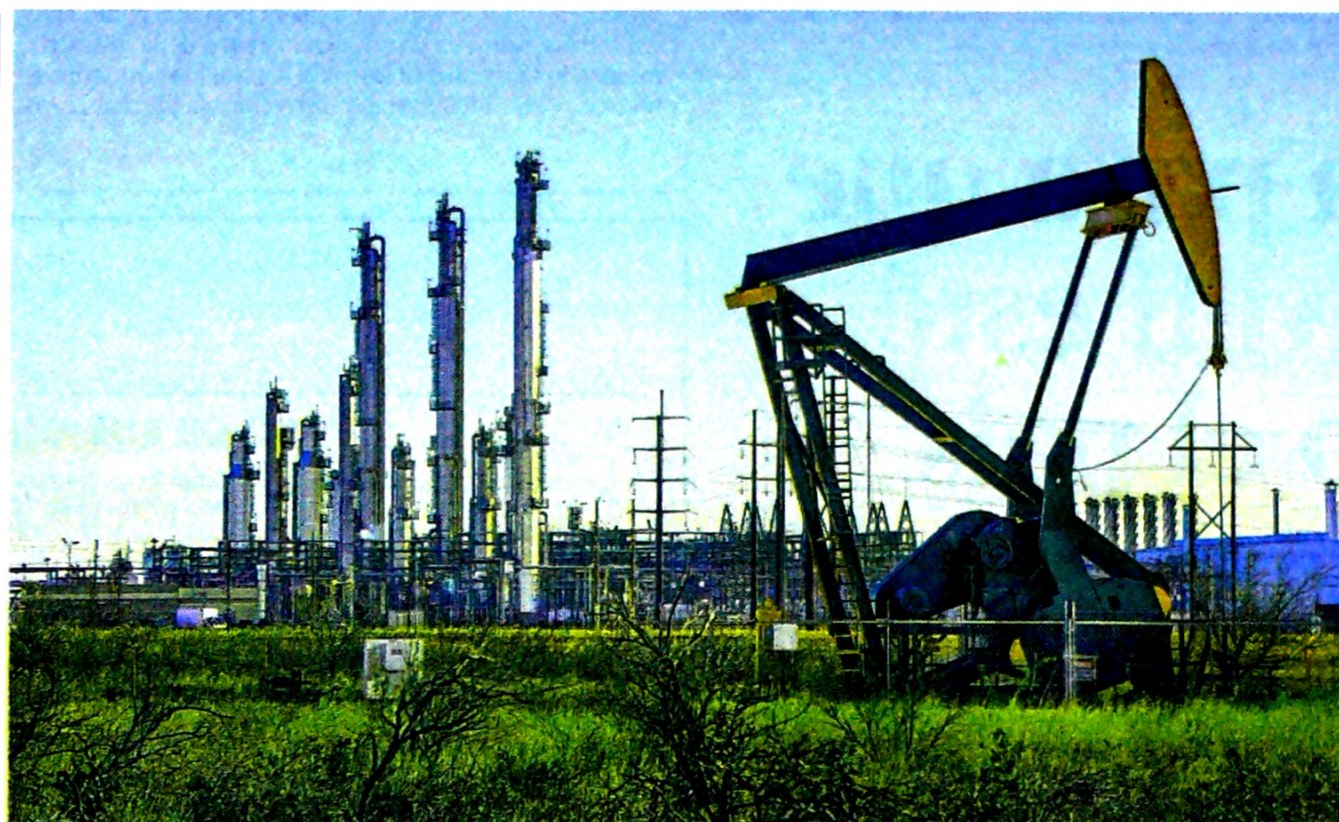
En el primer semestre la producción promedio diaria fue de 892.000 barriles, a 8.000 para llegar a los 900.000 barriles.

“La actividad se ha caracterizado, no solo por mantener las tareas, sino también por la puesta en marcha de campos”.