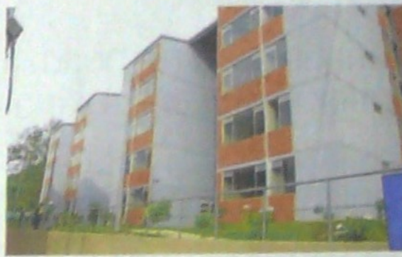
El sector de la construcción debe aprovechar las medidas aprobadas por el Gobierno para disminuir los inventarios No VIS y aumentar las VIS.

Con las anteriores medidas, el Ministerio de Vivienda espera otorgar entre 2020 y 2025, 178.540 subsidios a la cuota inicial y 298.540 coberturas a la tasa de interés con el programa Mi Casa Ya, por $9 billones. También se invertirán $1,4 billones para que más familias puedan hacer realidad el sueño de tener vivienda propia a través