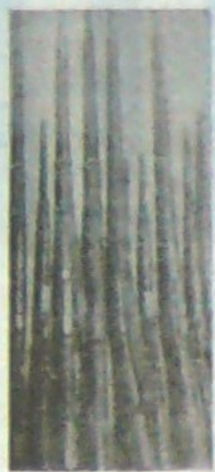
Imagen de uno de los arsenales liberales de Bogotá que tenía como destino Saboyá y que fue capturado por la Policía Militar. La foto recoge alguna de las armas de largo alcance decomisadas a un teniente del tristemente conocido frente García Ulloa.