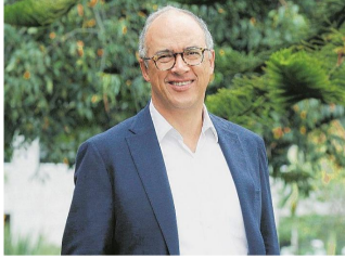
Juan Carlos Echeverry es reconocido como uno de los más importantes economistas del país.

J uan Carlos Echeverry, el mismo que fue ministro de Hacienda, presidente de Ecopetrol y director del Departamento Nacional de Planeación (DNP), el mismo economista y analista que desnuda las cifras y escribe ensayos de macroeconomía, resultó cuentista y novelista.