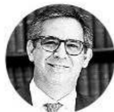
Eric Flesch CEO de Promigas

“Hay que apuntarle a varias fuentes de abastecimiento, priorizando lo nacional. Hay que esperar la ronda de gas que realizará la Agencia Nacional de Hidrocarburos”.