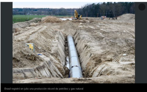
Brasil registró en julio una producción récord de petróleo y gas natural

Por | EFE | 3 de Septiembre de 2019 - 10:21 HS