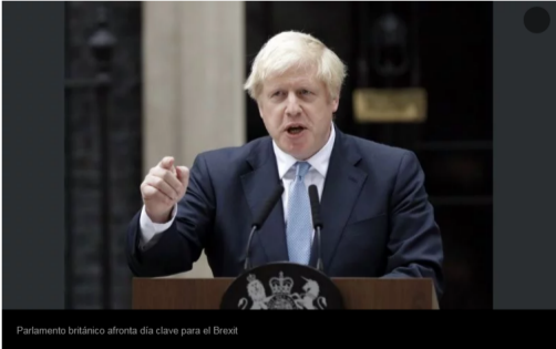
Parlamento británico afronta día clave para el Brexit

Por | AP | 3 de Septiembre de 2019 - 09:29 HS