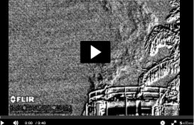
A lado de una escuela del municipio de Yondó, Antioquia, se encuentra ubicado un tanque de almacenamiento de petróleo que, al parecer, emite gases contaminantes.