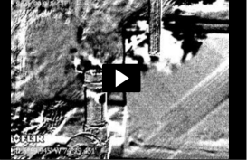
A través de una cámara Flir se logró evidenciar que el machine o bomba que se encuentra cerca al Colegio El Prado, en el municipio de Puerto Boyacá, emite gases.