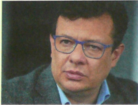
Hollman Morris (MAIS).