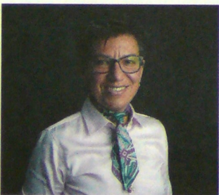
Claudia López (Alianza Verde).

El debate se hará a partir de las 8:00 a.m. en la Universidad Nacional y se podrá seguir en vivo a través de las páginas de El Espectador y Fesco. Asimismo, el auditorio estará abierto al público, que previamente hizo la inscripción. ■