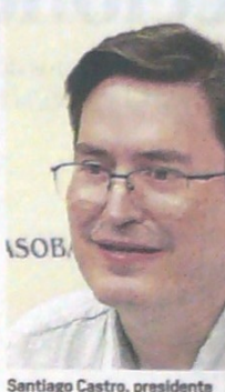
Santiago Castro, presidente de Asobancaria.

“La pérdida es de cuatro de cada $100 mil pesos tronzados, por lo que una de las tareas es analizar cómo se discriminan esas pérdidas (...) Entre más rápido se comparte una amenaza o vulnerabilidad, más posibilidades tendrán las otras entidades para poner en marcha la defensa adecuada para mitigarla. Cuantos más datos confiables tengamos, mejores serán las decisiones”, dijo.