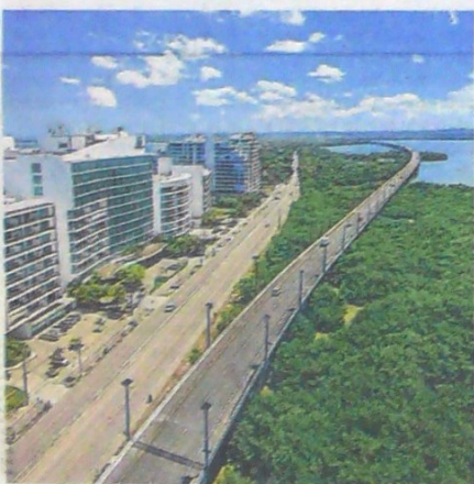
El viaducto del Gran Manglar es una de las obras más representativas hechas por la Concesión Costera.

Después de cinco meses de hacer la solicitud formal a la Aeronáutica Civil para operar la ruta aérea Ibagué - Cartagena, la aerolínea EasyFly confirmó que el próximo 16 de diciembre partirá el primer vuelo hacia la Heroica. La ruta tendrá una frecuencia de tres vuelos semanales. La tarifa por trayecto sería desde $250.090.