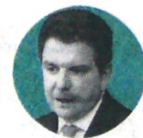
LUIS MIGUEL MORELLI Presidente ANH

Durante un evento privado al que asistieron más de 70 representantes de compañías petroleras presentes en Colombia y en otras partes del mundo, la Agencia Nacional de Hidrocarburos (ANH) mostró el portafolio disponible de 59 áreas convencionales para la puja de la segunda subasta del Proceso Permanente de Asignación de Áreas (PPAA) de 2019. En total, del paquete ofrecido, cinco bloques están ubicados costa afuera y los restantes en zona continental, en cuencas altamente prospectivas del país.