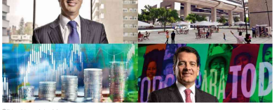
7 Siete noticias económicas de la semana

Firma del contrato del Metro de Bogotá, los nuevos objetivos de Telefónica y los planes 2020 de Ecopetrol son algunos de los hechos que marcaron la agenda económica de la semana.