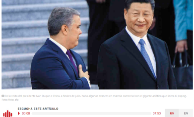
En la visita del presidente Xi Jinping a China, a finales de julio, hubo algunos avances en materia comercial con el gigante asiático que lidera Xi Jinping.

De una manera algo silenciosa pero constante han arribado más empresas del gigante asiático a Colombia. El metro de Bogotá es solo un ejemplo. ¿En dónde más están?