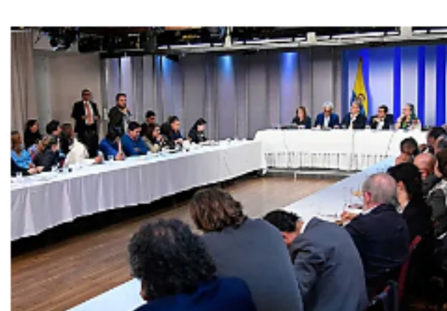
Varios ambientalistas se levantaron de la mesa de diálogos con el Gobierno