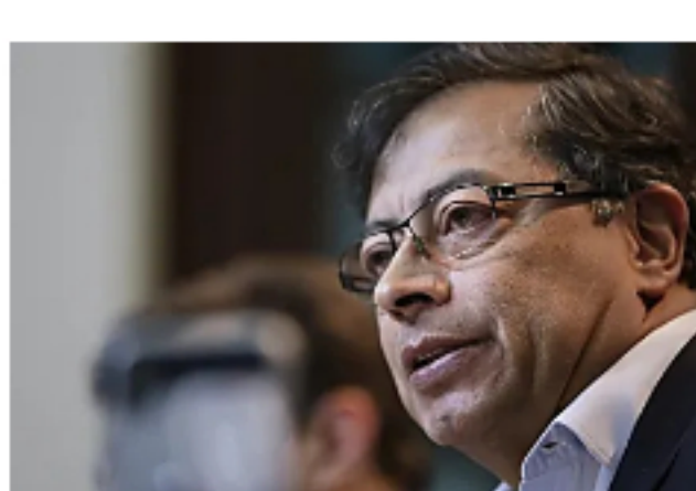
Sí hay quienes quieren tumbar a Duque, pero son los amigos de él: Petro (W Radio Colombia)