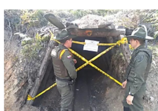
Cerca de 30 minas suspendidas en área metropolitana de Tunja en lo corrido de 2019