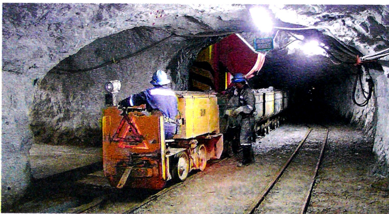
La implementación del nuevo catastro (Anna Minería) implica una reducción de costos a favor del inversionista.

“Otro de los puntos a resaltar de este nuevo catastro es el registro de usuarios, ya que le permitirá al usuario administrar sus propios datos desde el mismo momento en que accede a la plataforma. Como este es un sistema transaccional, la información registrada de-