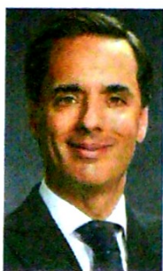
Alfonso Gómez Palacio, quien durante varios años fuera presidente ejecutivo de Telefónica Colombia, ahora liderará la región de Hispanoamérica.

El colombiano Alfonso Gómez será el presidente en la nueva zona, integrada por 8 países, sin Brasil. El reto es fortalecer el negocio.