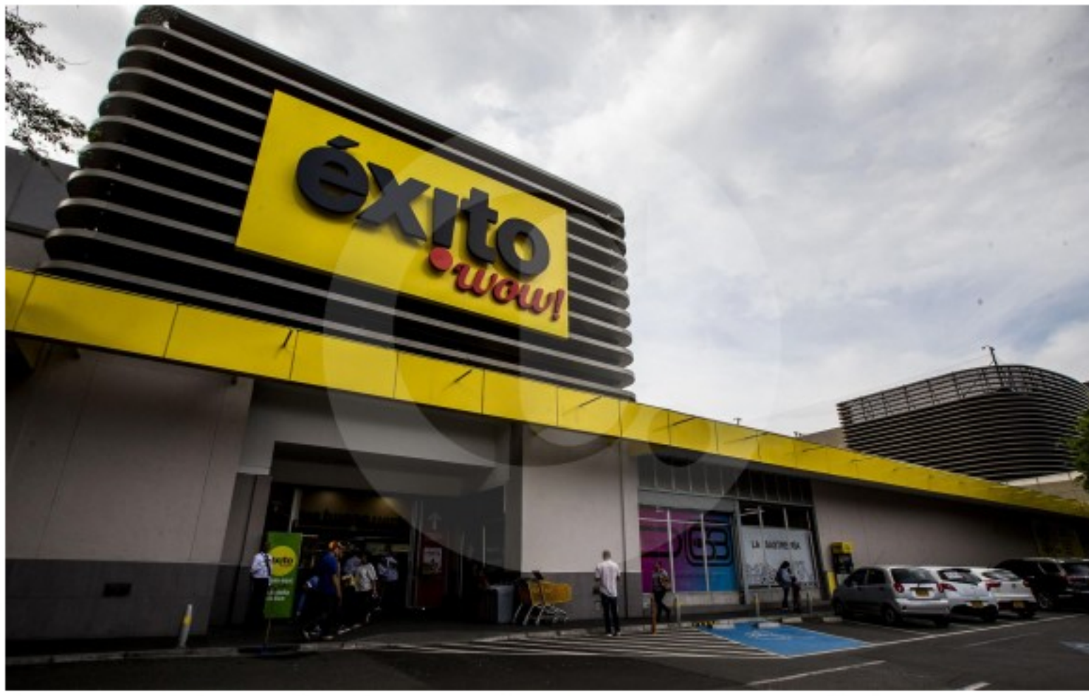
El plan de Grupo Éxito contempla acelerar su expansión en formatos rentables.

ACCIONES BOLSA DE VALORES BRASIL COLOMBIA GRUPO ÉXITO