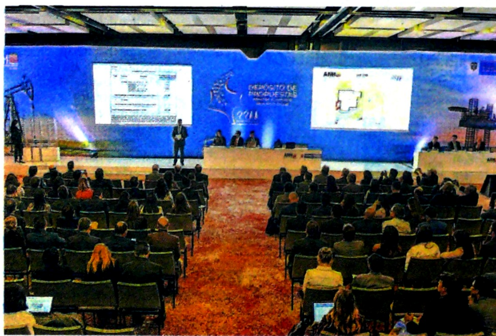
El próximo 5 de diciembre en el proceso de contraoferta se espera crecer la inversión. ANH

En cuanto a los resultados de la Subasta, esta dejó inversiones por US$500 mi-