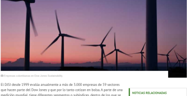
© Empresas colombianas en Dow Jones Sustainability

Así les fue a las principales firmas colombianas en el Dow Jones Sustainability Index (DJSI) que evalúa varios aspectos de sostenibilidad en las empresas. Nutresa, Avianca, Bancolombia, Grupo Argos y Davivienda son algunas de las que están en esta medición. Así les fue.