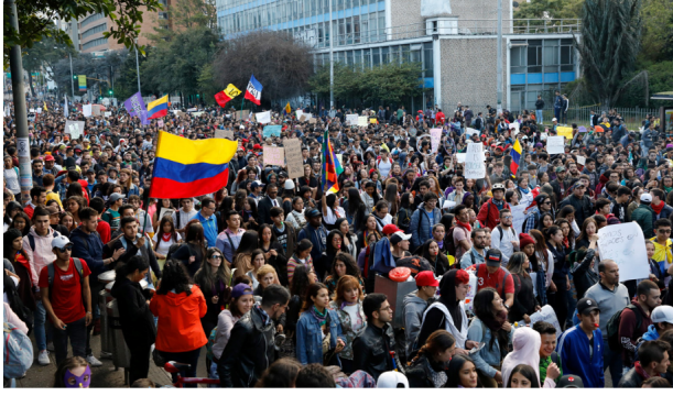
Protesta antigubernamental en Bogotá, Colombia, 25 de noviembre de 2019.

Las manifestaciones en Colombia comenzaron el pasado 21 de noviembre. En su página web, el Comité de Paro Nacional informó que entre las motivaciones de las protestas está "la política económica de los últimos gobiernos, más recomendaciones de la Organización para la Cooperación y el Desarrollo Económicos (OCDE) y los reiterados incumplimientos del gobierno" a las demandas sociales.