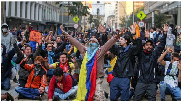
Protesta en Bogotá, Colombia, 22 de noviembre de 2019.

Se negaron a aceptar el diálogo ampliado propuesto por el mandatario Iván Duque.