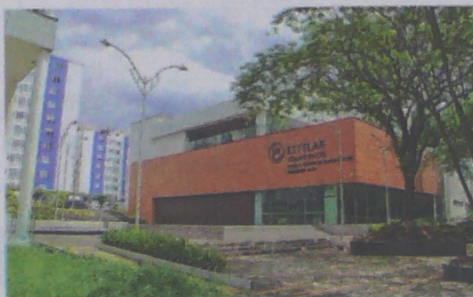
En hotelería, el informe trimestral de Corficolombiana muestra aumento en ocupación, de 59 al 62 % de hoteles.

El accionista principal del Grupo Aval también es el mayor accionista de EL TIEMPO.