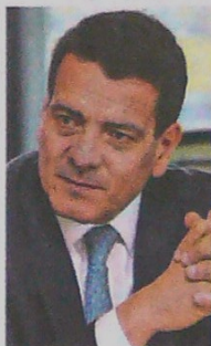
Felipe Bayón, presidente de Ecopetrol.

Este año dijimos que serían 500 millones de dólares, pero estamos viendo ya unos 140 millones de dólares en algunas áreas puntuales. En su momento lo iremos decantando y contando.