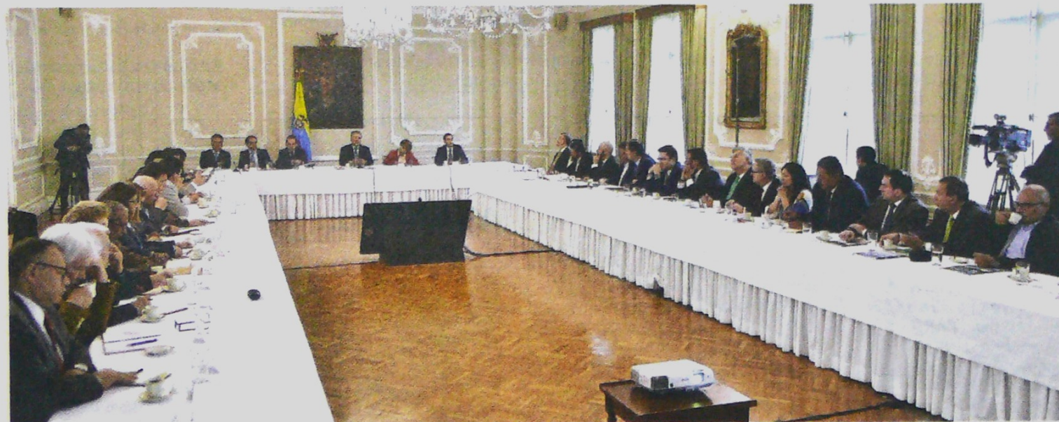
El presidente Iván Duque se reunió ayer con las centrales obreras y hoy lo hará con los organizadores directos de las manifestaciones.

Mientras siguen las protestas, ayer fue creada la holding financiera, uno de los puntos en pugna detrás de las marchas. Arrancaron los diálogos en Palacio. Pág. 8