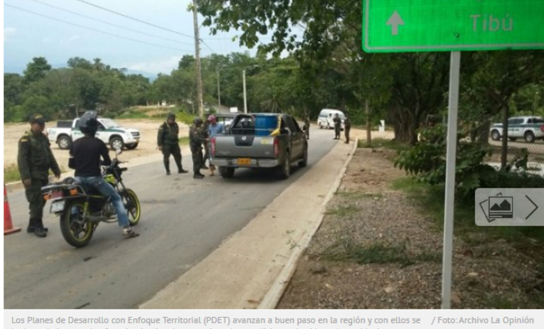
Los Planes de Desarrollo con Enfoque Territorial (PDET) avanzan a buen paso en la región y con ellos se ha logrado integrar la oferta institucional para mejorar las condiciones de vida en las poblaciones urbanas y rurales.

La inversión social en esta región es un ejemplo de lo que podría ocurrir en otras regiones como Cauca, Bajo Cauca antioqueño y Nariño.