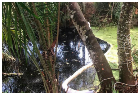
Según Ecopetrol, los trabajos se extenderán por varios días, para superar la emergencia que afectó parte del ecosistema.

Se presume que el elemento fue instalado sobre la infraestructura petrolera para facilitar el hurto de hidrocarburos, como ha sucedido en otros puntos del Magdalena Medio. Los casos más recientes se han concentrado en zona rural de Puerto Wilches y Barrancabermeja, dejando grandes afectaciones ambientales.