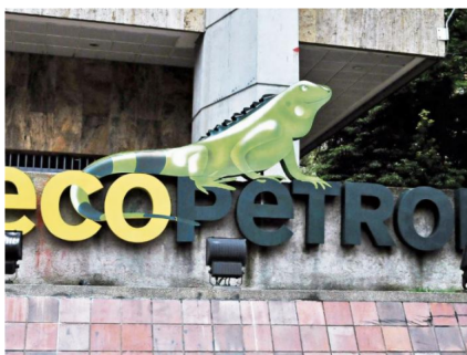
Con los nombramientos, Ecopetrol marca nueva etapa.

FOR: PORTAFOLIO · NOVIEMBRE 25 DE 2019 · 08:16 A.M.