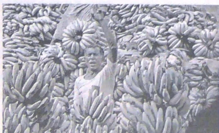
El banano fue uno de los productos destacados.

LAS VENTAS externas distintas a minas y energía tuvieron un crecimiento en septiembre de este año.