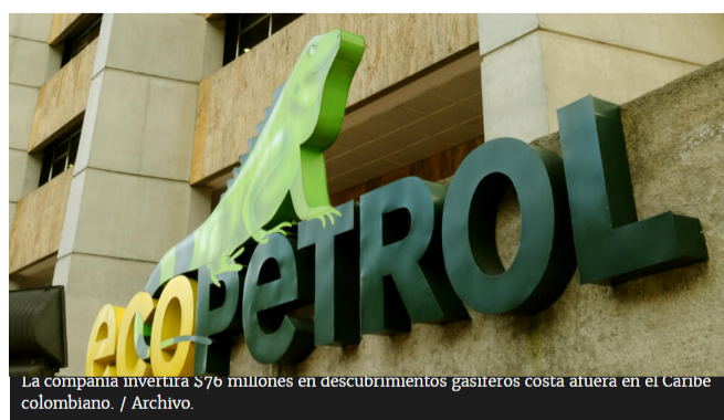
La compañía invertirá $70 millones en descubrimientos gasíferos costa afuera en el Caribe colombiano.

La petrolera destinará entre US$4.500 millones y US$5.500 millones en exploración y producción, principalmente. 'Fracking' y energía renovable también recibirán recursos importantes.