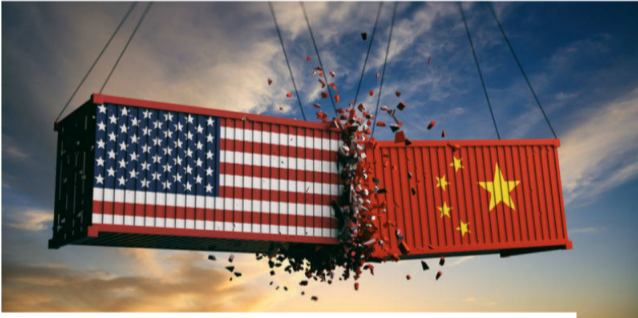
Mercados bailan al ritmo de retórica comercial entre EE.UU. y China

Los inversionistas 'siguen con atención la retórica cotidiana' sobre la disputa comercial entre las dos potencias económicas, señalan los analistas.