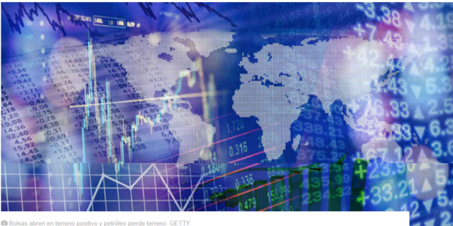
Bolsas abren en terreno positivo y petróleo pierde terreno.

Los mercados sienten como una señal positiva las declaraciones hechas por China, que manifestó fortalecer las medidas en propiedad intelectual, lo cual puede significar avances con Estados Unidos.