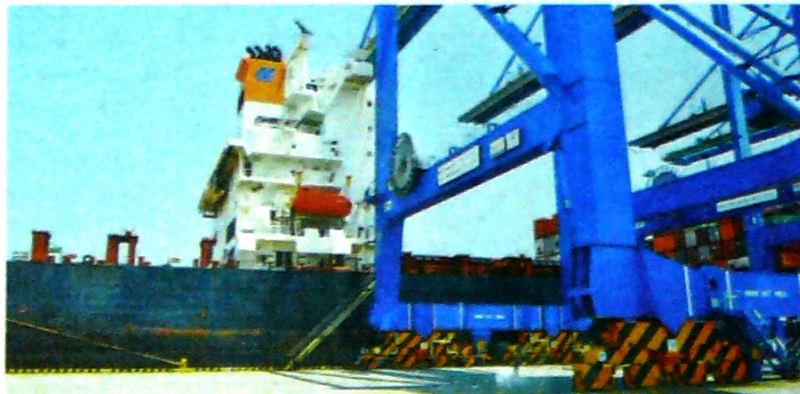
LAS EXPORTACIONES de sectores no minero-energéticos mostraron buen comportamiento en septiembre de este año.

También se destacan los insecticidas, cuya facturación externa