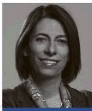
Rosario Córdoba Presidenta del Consejo Privado de Competitividad