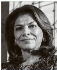
Laura Chinchilla Exponenta de Costa Rica