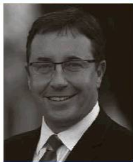
Achim Steiner Administrador mundial del PNUD