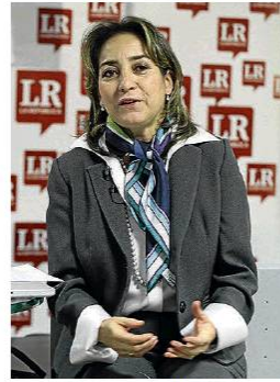
Grupo Energía de Bogotá

Con este proceso, el Grupo Bogotano entrará a ser parte de Argo, una plataforma que forma parte del sistema de transmisión de electricidad de Brasil, y que tiene tres concesiones en los Estados de Ceará, Maranhão,