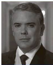
Iván Duque Márquez Presidente de Colombia

¡Conozca algunos de los conferencistas que acompañarán el lanzamiento mundial del Informe de Desarrollo Humano!