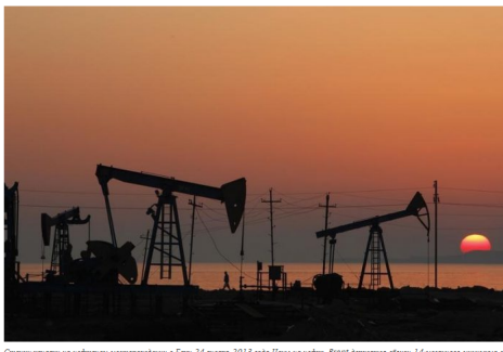
Силуэты насосов на нефтяном месторождении в Баку 24 января 2013 года. Цены на нефть Brent вернутся выше 14-дневного максимума с возможностью дальнейшего повышения на фоне достаточного предложения и сложной геополитической обстановки.

La Administración de Información de Energía de EE. UU. (EIA por su sigla en inglés) revisó hoy su pronóstico de producción de petróleo crudo basándose principalmente en dos factores: actualizaciones de sus datos históricos y el pronóstico del precio del petróleo crudo.