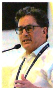
El ministro Alberto Carrasquilla durante su intervención en el panel.

En momentos en que el sector de la infraestructura y otros renglones insisten en la venta de participaciones en empresas estatales, como Ecopetrol o ISA , para destinar el dinero a financiar nuevos proyectos de infraestructura, ante las restricciones fiscales por el uso de vigencias futuras para respaldar el programa vial de cuarta generación (vías 4G), el Gobierno, en cabeza del ministro de Hacienda, Alberto Carrasquilla, recalca la necesidad de "ser más creativos" en este frente. Y durante su intervención en un panel en el 16.º Congreso Nacional de Infraestructura, el jefe de las finanzas públicas le dio un cam-