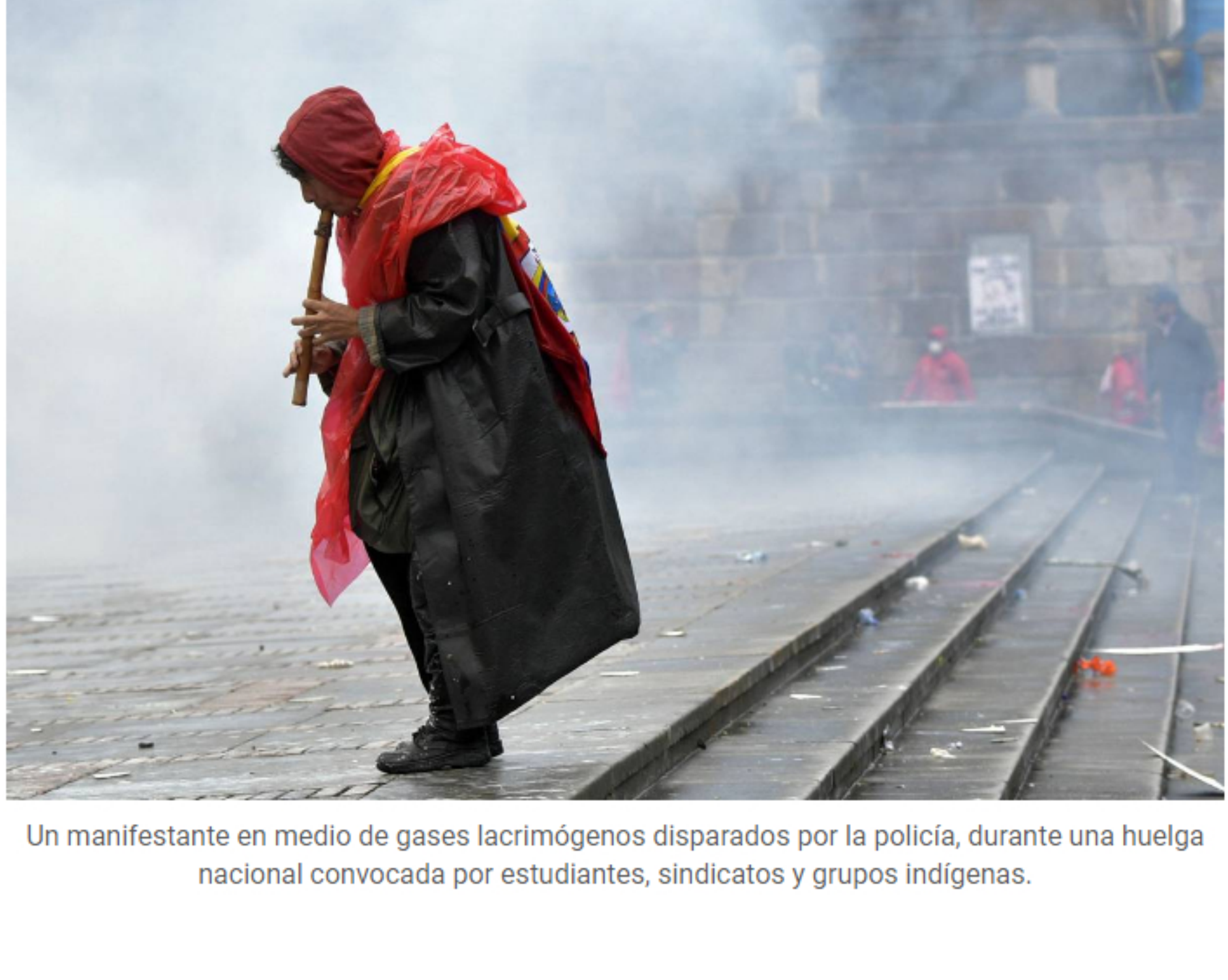
Un manifestante en medio de gases lacrimógenos disparados por la policía, durante una huelga nacional convocada por estudiantes, sindicatos y grupos indígenas.