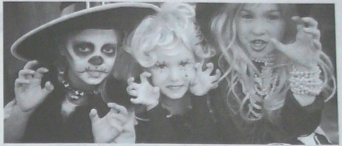
La celebración del Halloween por parte de todos los sectores poblacionales jaló el comercio durante octubre, que fue al alza.

Se calcula que más del 90% de los auxilios monetarios que