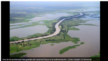
Uno de los problemas más grandes del canal del Dique es la sedimentación.

MARYLIN MARTÍNEZ MARTÍNEZ | @EiUniversalCtg | 19 de noviembre de 2019 10:54 AM