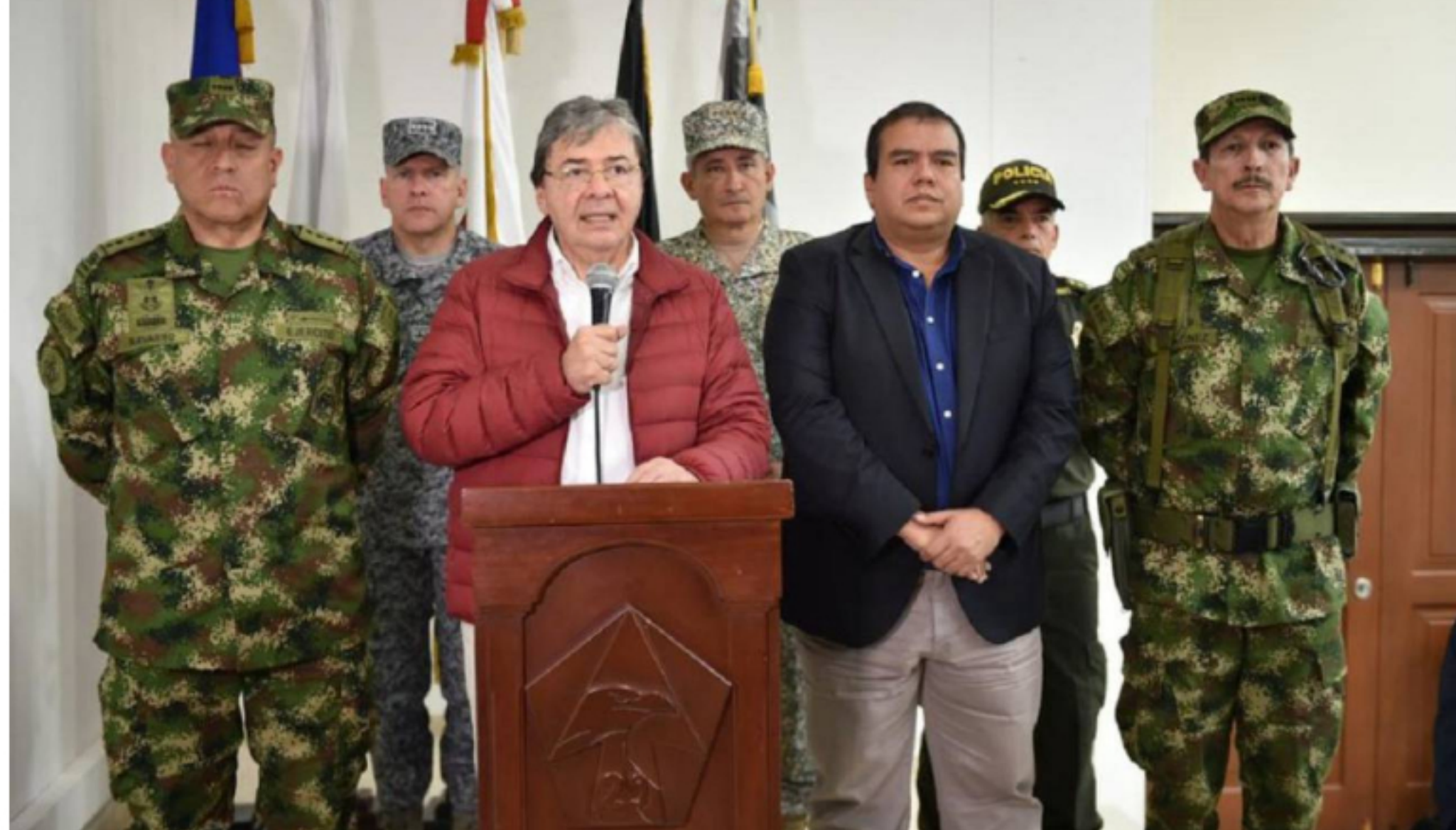
Ministerio de Defensa

El ministro de Defensa aseguró que se actuará con contundencia frente a las manifestaciones violentas, si estas se presentan el 21 de noviembre.