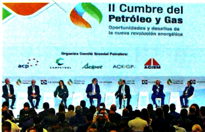
El presidente Iván Duque (centro), durante la clausura de la 2.ª Cumbre de Petróleo y Gas que se realizó en Bogotá.

"Lo importante es rescatar esta inversión que está atrapada en las restriccio-