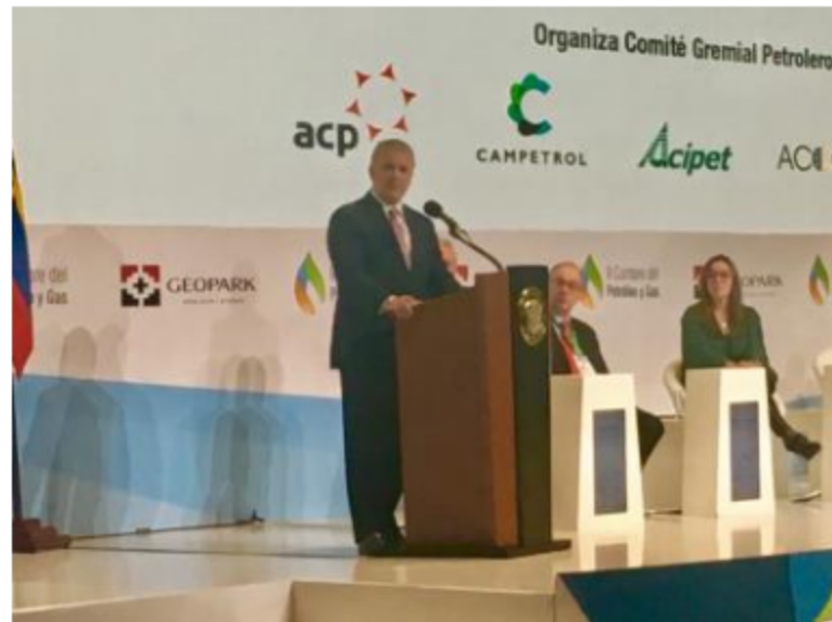
El presidente Duque resaltó la participación de las empresas del sector en negocios de fuentes energéticas renovables

El presidente de Colombia, Iván Duque, clausuró la II Cumbe de Petróleo y Gas que organizan los gremios vinculados al sector de hidrocarburos en este país, enviando un mensaje que se convierte en un espaldarazo hacia esta industria tomando en cuenta las críticas que se expresan por parte de dirigentes políticos y organizaciones no gubernamentales que se oponen a los proyectos petroleros y gasíferos.