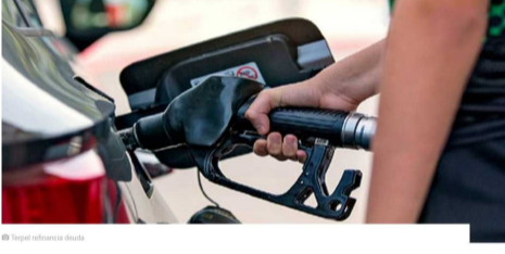
Terpel refinancia deuda

La Organización Terpel S.A tomó la decisión de refinanciar la deuda de 316.037 millones de pesos, que había adquirido en marzo del año pasado, con el fin de adquirir los activos de ExxonMobil en la región. La decisión fue tomada por Junta Directiva en la sesión adelantada a finales del mes de febrero, y con esta se busca disminuir los costos financieros y aumentar el plazo de los créditos de corto plazo. Por medio de un comunicado, la empresa colombiana informó este refinanciamiento no causará impactos negativos en el área comercial, ni en su situación financiera.