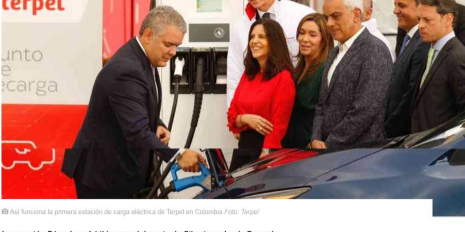
Así funciona la primera estación de carga eléctrica de Terpel en Colombia.

Con la marca Voltex, Terpel hace su apuesta por conectar las principales vías del país, fomentando el uso de energía limpia. Duque resaltó los compromisos ambientales del gobierno, de la mano de la empresa privada.