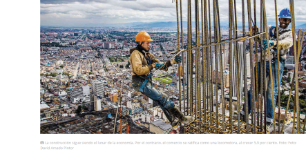
La construcción sigue siendo el pilar de la economía. Por el contrario, el comercio se ratifica como una locomotora, al crecer 5,9 por ciento.

Mientras el país avanza a su mayor ritmo desde el tercer trimestre de 2015, la desocupación se mantiene alta y desaparecen puestos de trabajo. ¿Qué pasa?